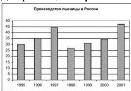
Диаграмма для вопросов 4-6

Вопрос 4. На столбиковой диаграмме показано производство пшеницы в России с 1995 по 2001 год (млн.тонн). По диаграмме определите в каком году наблюдалось падение производства пшеницы в России по сравнению с предыдущим годом?